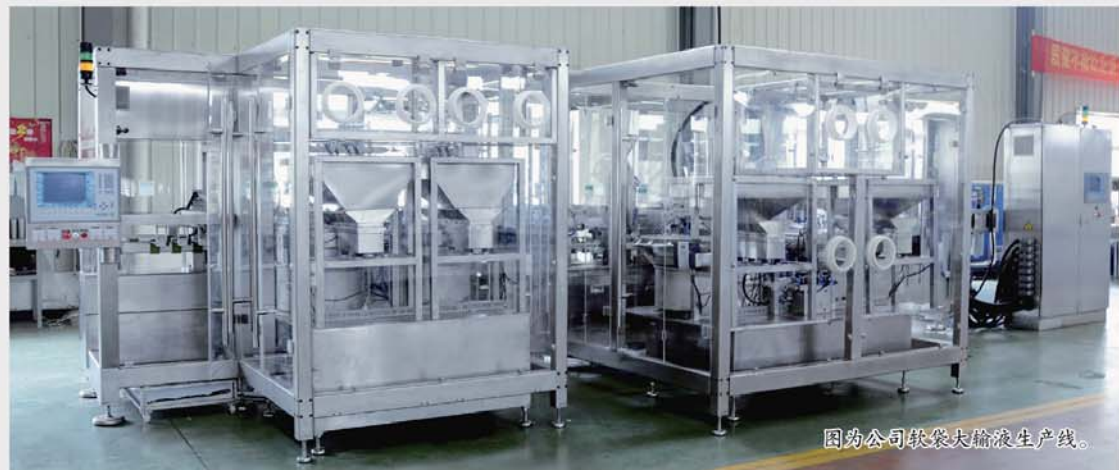
因药公司袋装大输液生产线。

在年前招标的石家庄四药四条软袋线项目中,我公司 SRD 型软袋线全部中标,这是四药对千山大输液设备的一次有力肯定。