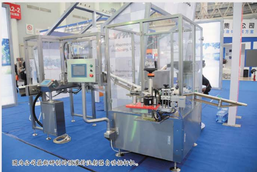
图为公司最新研制的预灌封注射器自动插杆机。

长期以来,注射用药物的包装一直采用西林瓶或安瓿,使用时抽入注射器后再进行注射。预灌封注射器能把液体药物直接装入注射器中保存。其具有安全无菌、领域广泛、使用方便、储存稳定等显著优点,并得到西方国家的