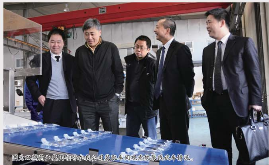
图为双鹤药业集团领导在千山公司设备车间观看技术装备情况。

面着手努力;继续加强小容量产品的销售力度,积极开拓新市场;加强与客户的沟通,了解客户的计划和意图,做到有针对性地销售;提升团队素质,加强业务水平,在销售过程中注重产品知识学习,做到有问必答,把产品的优势渐渐地传递给客户,特别要加强新产品的市场推广,尽早