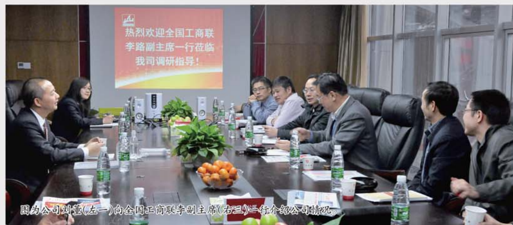
图为李路副主席(左一)向千山工商联李路副主席(右三)介绍公司情况。

本报讯 1月20日下午,在湖南省委统战部、省工商联领导的陪同下,全国工商联党组成员、副主席李路一行莅临公司考察调研。